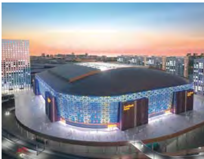
Swedbank Arena, Sveriges nya nationalarena, ska stå klar för invigning någon gång under andra halvåret 2012.

Det här är absolut ingen stridsfråga eller makt-